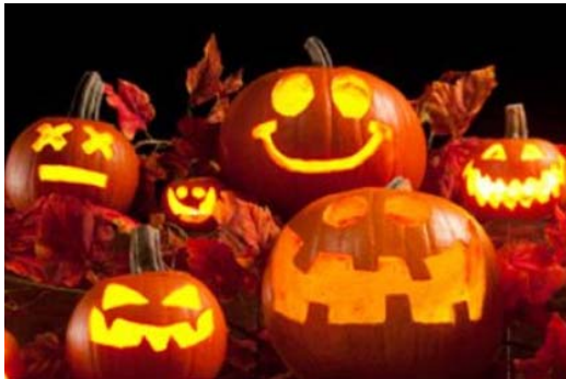
Foto is slechts een voorbeeld van internet Op donderdag 18 oktober a.s. van 10 uur tot ca. 12 uur in de Fonkel gaan wij met Diny van Loon pompoen snijden. U hoeft wederom niets mee te nemen met uitzondering van een (ronde) schaal. Alles wordt verzorgd inclusief het materiaal om de pompoen te snijden en natuurlijk inclusief de pompoen zelf.

Het materiaal dat Diny meeneemt is geheel gebaseerd op het aantal deelnemers en omdat dit op 18 oktober zal gebeuren vragen wij u zich al meteen bij ontvangst van dit journaal aan te melden zodat u dit niet kan missen.