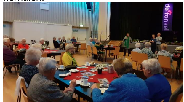
20 oktober herfstfeest bij SOOS40