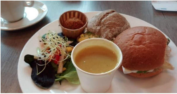
7 juni stadskamer