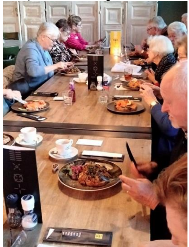
7 oktober de dag van de ouderen 85+ middag, die we zeker volgend jaar herhalen.