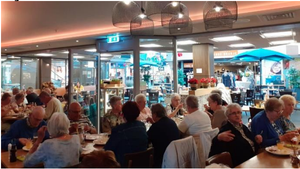
31 augustus KBO (kom bij ons) bij La Bocca grande