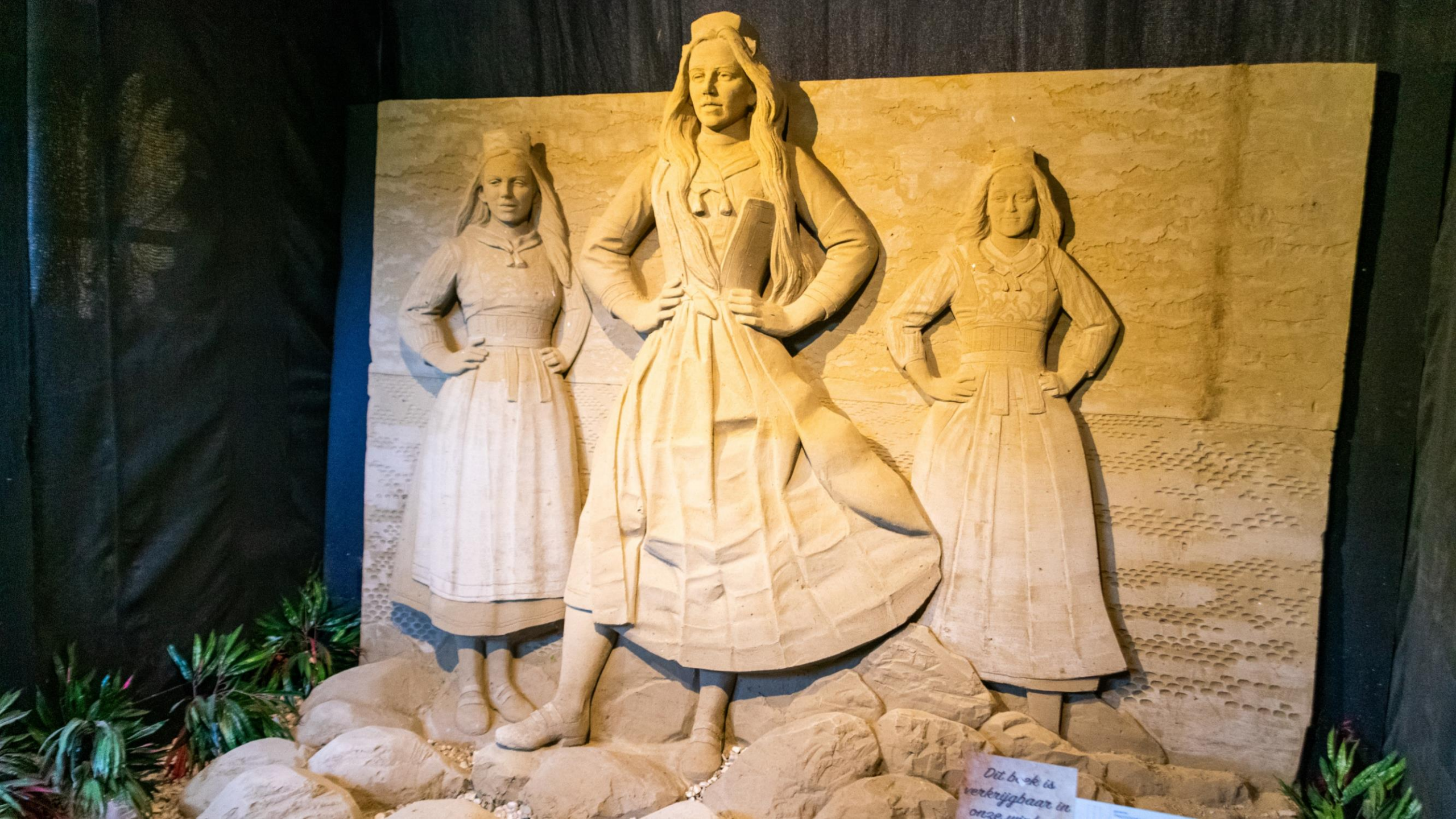
Dit boek is verrijgbaar in onze winkel