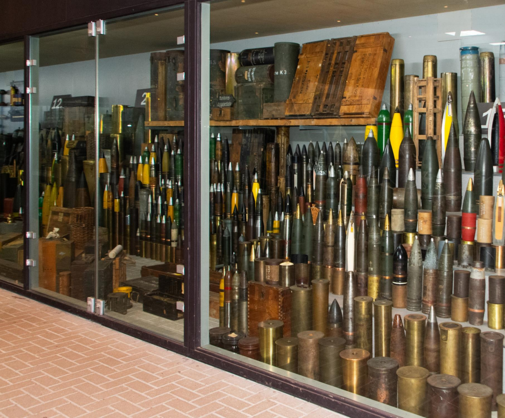
1000 Bommen e collectie Ben Junier