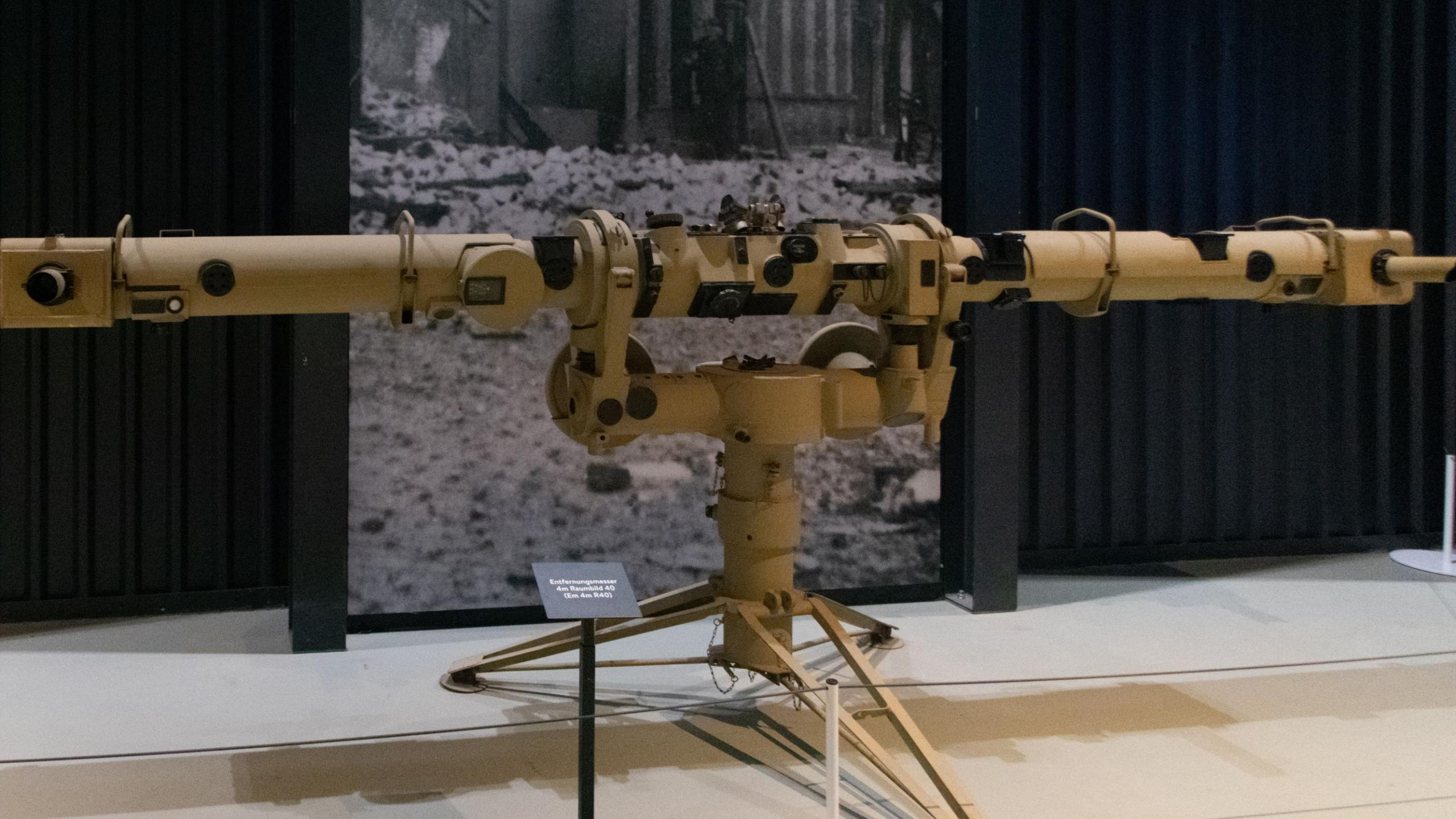
Entfernungsmesser 4m Raumbild 40 (Em 4m R40)