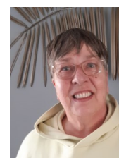
Gonny (asp. lid)